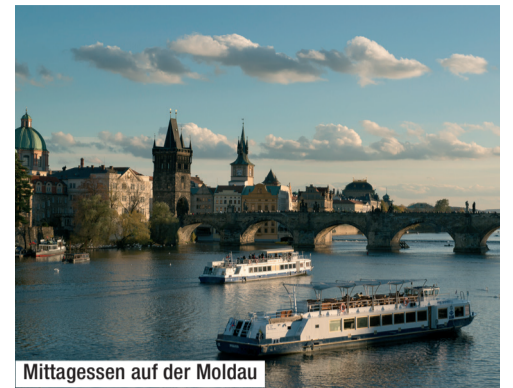
Mittagessen auf der Moldau