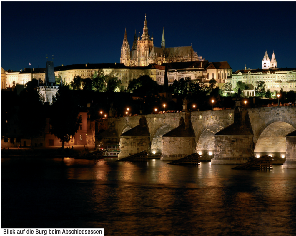
Blick auf die Burg beim Abschiedessen